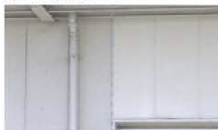
塗布なし クリーンマジック塗布