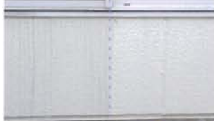
塗布なし クリーンマジック塗布